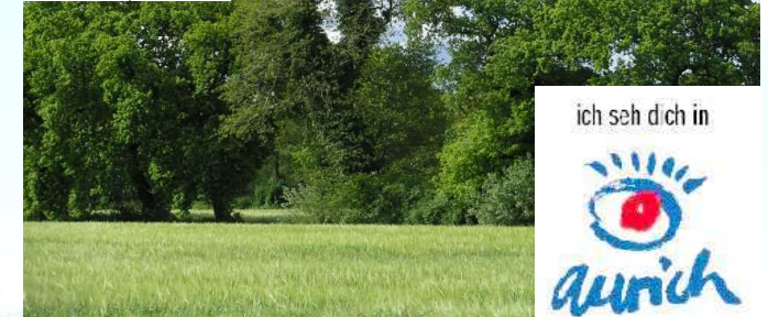
Die Umgebung Aurichs ist ohne Wallhecken nicht vorstellbar