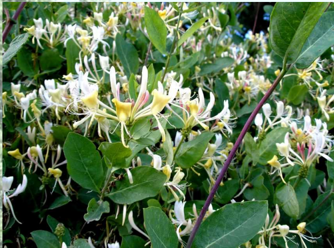
Blühende Pracht: Waldgeißblatt, eine häufig auf Wallhecken anzutreffende Lianenpflanze

Besonders zweckmäßig sind Flächen, die keiner intensiven landwirtschaftlichen Nutzung mehr unterliegen, so z.B. die Flächen privater Pferdehalter, von Hobby-Landwirten o.ä. Ansonsten sind Wallhecken-Neuanlagen z.B. auf Flächenrändern insbesondere entlang von Wirtschaftswegen und Straßen denkbar.