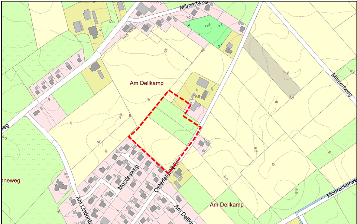
Abbildung 2: Lage des Geltungsbereiches im Ortsteil Wiesens (AK 5, www.geolive.de ).