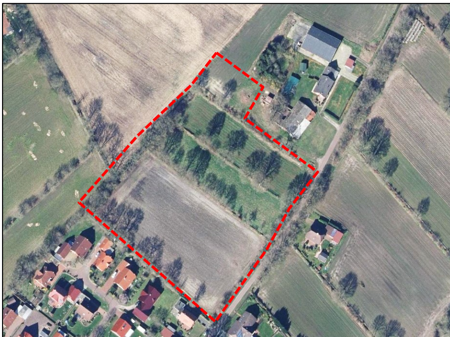
Abbildung 3: Luftbild Ende März 2020.

Das Baugebiet ist als „allgemeines Wohngebiet“ (WA) im Anschluss an eine südwestlich bereits bestehende Wohnsiedlung geplant und erhält eine Zufahrt von der Osterfeldstraße aus. Im Norden wird ein Regenwasser-Rückhaltebecken vorgesehen. Die Wallhecken bleiben erhalten, die Durchfahrten sind so vorgesehen, dass keine der großen, alten Walleichen auf den Wallhecken entfernt werden muss.