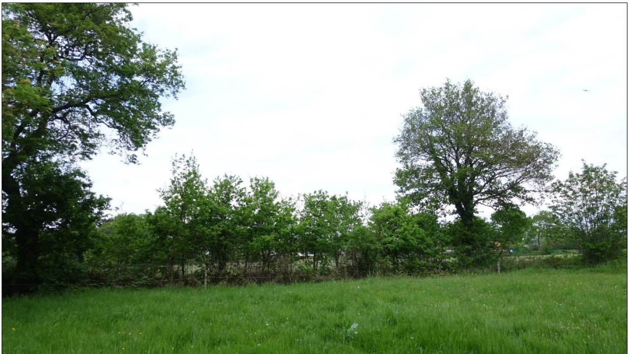
Abbildung 7: Wallhecke (Abschnitt HWS) am Nordostrand des UG, Blick nach NO.