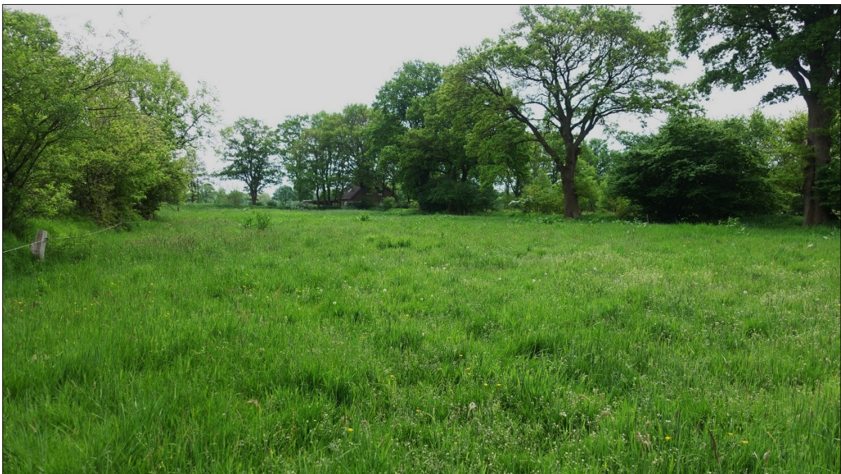
Abbildung 12: Grünland der Aufn.-Nr. 11, GETmw; (GEFmw). Blick nach SO.