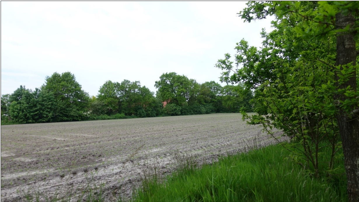
Abbildung 13: Maisacker, gerade bestellt, Blick Richtung NW.