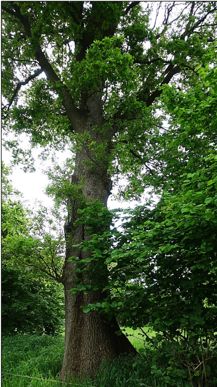
Abbildung 14: Walleiche mit Stammspalt, Wallhecke Nr. 3.

Gefäßpflanzenart vor (RL 3). Als Frühjahrsgeophyt kommt auf Wallhecke Nr. 2 der Salomonssiegel ( Polygonatum multiflorum ) vor.