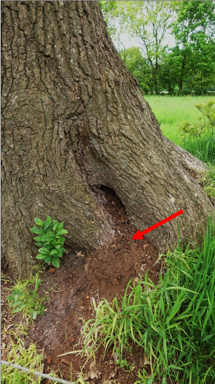
Abbildung 5: Waldameisennest (Pfeil) an einer starken Stiel-Eiche auf Wallhecke der Aufn. Nr. 3.