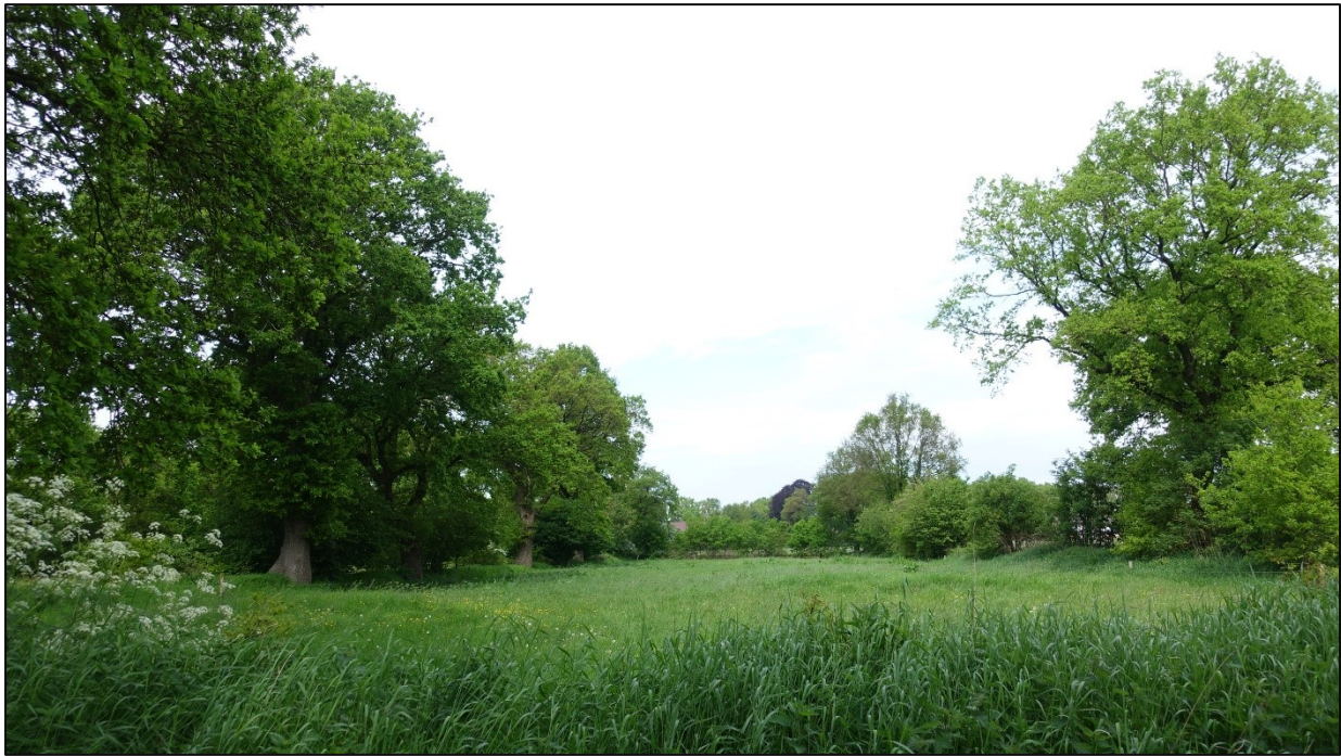
Abbildung 8: LINKS Wallhecke Nr. 3 mit drei sehr starken, alten Stieleichen.