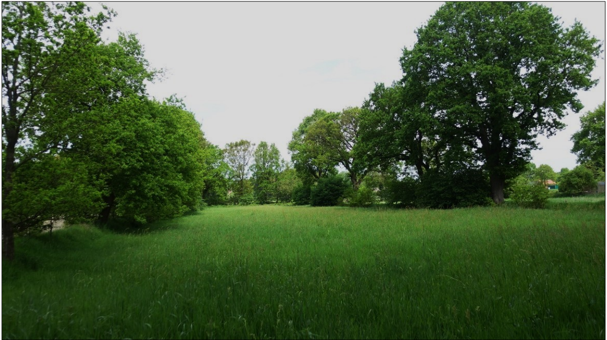
Abbildung 11: Fläche der Aufn.-Nr. 10, GETm, Blick nach Norden.