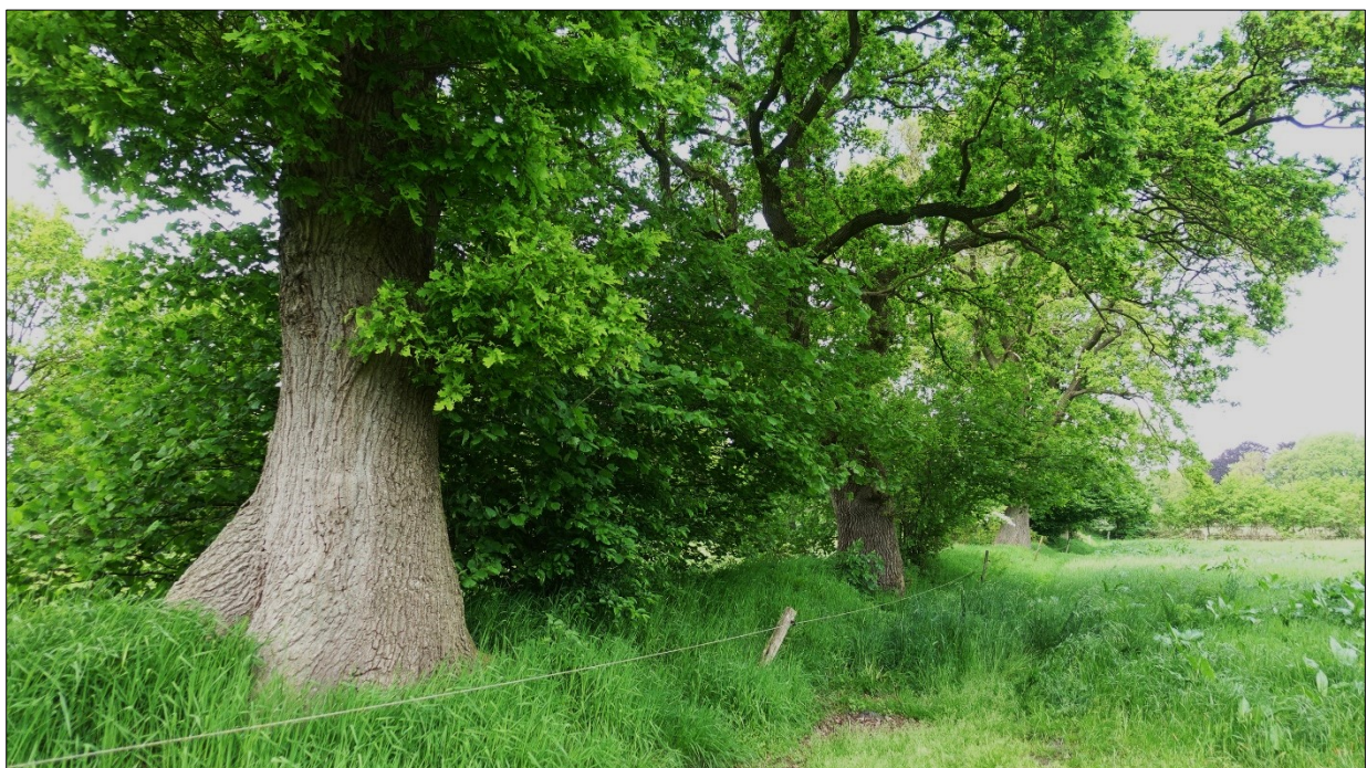
Abbildung 10: sehr starke Eichen auf dem Wall Nr. 3, teils auch mit Stammhöhlen und -spalten.