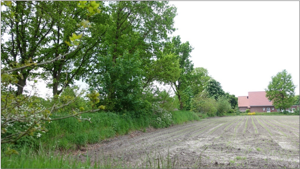
Abbildung 6: Wallhecke d. Aufn.4, Blick nach SO.