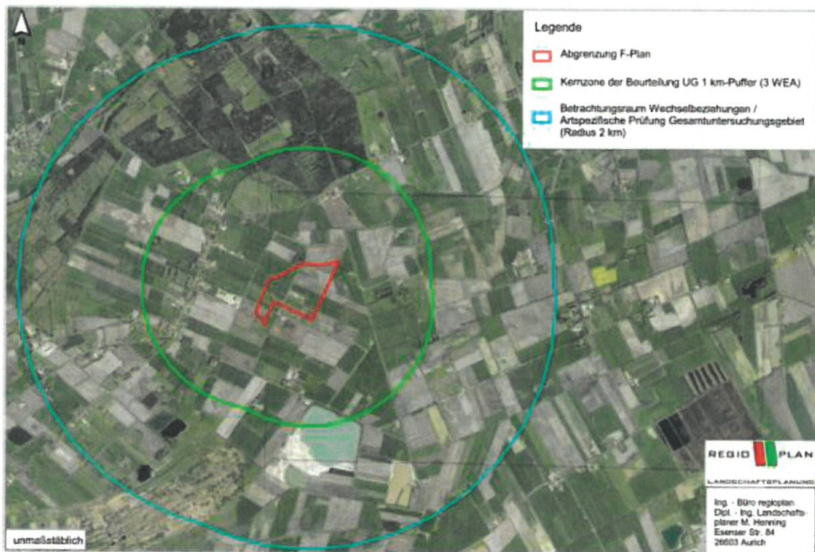
Abb. 2: Untersuchungsgebiet

Die Abgrenzung der Betrachtungs-/Beurteilungsräume ist der nachfolgenden Abbildung Nr. 2 zu entnehmen.