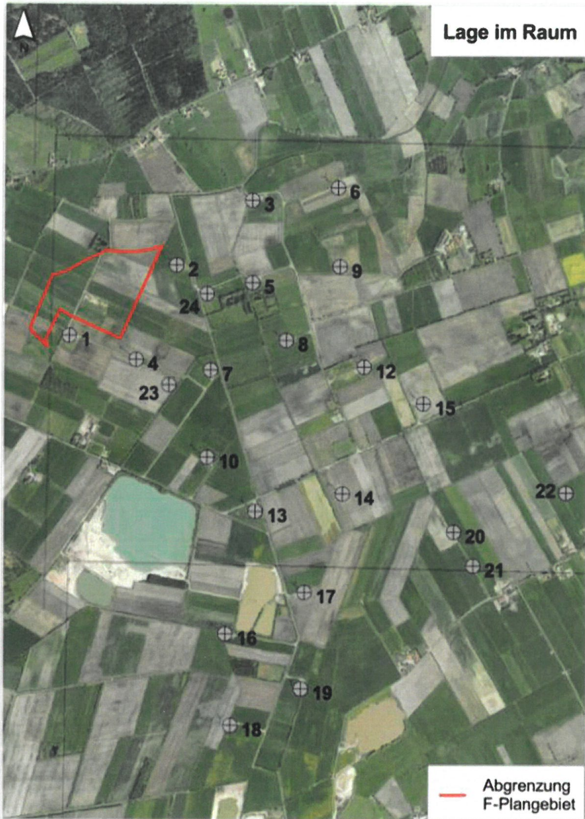
Abb. 1: Teilfläche „Buchweizenweg“ der 45. Änderung der Flächennutzungsplanung Stadt Aurich